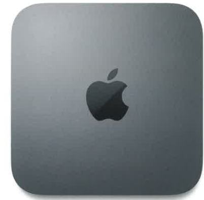
Mac mini Apple, USA In-house Design Red Dot 2019

Apple ist eines der Paradebeispiele dafür, wie sehr Design alle Bereiche eines Unternehmens durchdringen und dieses formen und erfolgreich machen kann. Hardware, Software, Brand und Corporate Design, Anzeigenkampagnen, Services, Packaging und Retaildesign – selbst die Inszenierung der eigenen Person bei den Produktpräsentationen waren zur Zeit von Steve Jobs (1955–2011) bis ins letzte Detail durchgestaltet. Damit demonstriert das Beispiel Apple, dass Design, richtig verstanden, ein Qualität schaffender Faktor in Produktentwicklung und Unternehmenskommunikation ist.