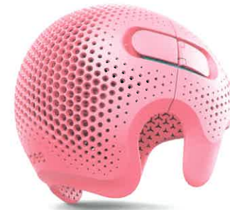
Talee Cranio-Orthese Invent Medical Group, Tschechische Republik In-house Design Red Dot: Best of the Best 2019

Die Cranio-Orthese Talee dient der Therapie kindlicher Schädeldeformationen und bietet dank Nutzung von 3D-Technologie die Möglichkeit einer individuellen Anpassung. Durch ihre freundliche, kindgerechte Gestaltung wirkt sie zudem einer Stigmatisierung der Kinder entgegen.