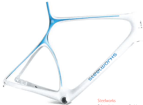
Steelworks Fahrradrahmen aus Stahl thyssenkrupp Steel Europe, Deutschland In-house Design Red Dot: Best of the Best 2019

Materialien sind eine wichtige Inspirationsquelle für die Entwicklung innovativer Produkte. Hierunter fallen nicht nur neue Materialien im engeren Sinne, sondern auch neue Technologien oder neue Möglichkeiten der Bearbeitung und Produktion. Sie sind einer der stärksten Innovationstreiber im Produktdesign, denn sie ermöglichen sowohl die Schöpfung völlig neuer Produkte als auch die stetige Verbesserung existierender Gegenstände.