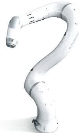
Hyundai Robot YL012 Kollaborativer Roboter Hyundai Robotics, Südkorea In-house Design Design: Hyundai Heavy Industries, Südkorea Red Dot: Best of the Best 2019

Ein Beispiel für ein Produkt, bei dem die Qualität der Verführung deutlich sichtbar wird, ist der Hyundai Robot YL012. Dieser Arbeitsroboter ist alles andere als rein funktional gestaltet. Seine fließende Formensprache verleiht ihm eine lebendige Anmutung, nimmt Berührungängste und weckt Sympathien.