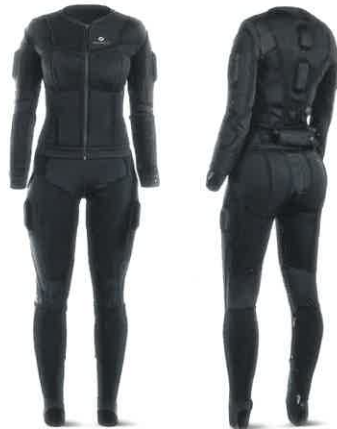
Teslasuit Haptischer Ganzkörperanzug VR Electronics, Großbritannien In-house Design Red Dot: Best of the Best 2019

Faszinierend im Gebrauch ist der Teslasuit – im Prinzip eine Ganz-körperschnittstelle zwischen Nutzer und digitaler Umgebung, die ein Höchstmaß an Bewegungsfreiheit bietet. Der Anzug integriert die anspruchsvolle Technologie perfekt und weckt beim Nutzer das Gefühl, mit der digitalen Realität zu verschmelzen.