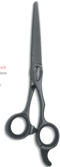
Joewell SPM Black Haarschneideschere Tokosha, Japan In-house Design Red Dot 2019

Eine besonders präzise und sorgfältige Herstellung offenbart sich Menschen oft erst im Gebrauch. Solche Produkte erfüllen Erwartungen, von denen der Käufer nicht einmal wusste, dass er sie hatte. Die Qualität wird zum Erlebnis. Allerdings hat solche Qualität auch ihren Preis: Die letzten zehn Prozent Qualitätszuwachs können die Herstellungskosten noch einmal verdoppeln.