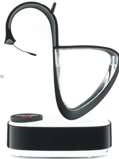
Infinissima Kapsel-Kaffeemaschine Nescafé Dolce Gusto, Schweiz Design: Multiple, Schweiz Red Dot 2019

Eine markante Formgebung verleiht Produkten einen hohen Wiedererkennungswert. Solche Produkte stechen aus der Masse heraus und prägen sich in unser Gedächtnis ein. Ikonische Formen verhelfen Produkten dazu, zu Designklassikern zu werden, die sich manchmal über Jahrzehnte hinweg am Markt halten können. Wahre Qualität in der Form ist zeitlos.