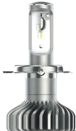
Philips X-tremeUltinon gen2 LED retrofit LED-Fahrzeugbeleuchtung Lumileds, Frankreich Design: Signify Design Team, China; Philips Design, Niederlande Red Dot: Best of the Best 2019

Ein Beispiel für die Qualität der Funktion ist die Philips X-treme-Ultinon gen2 LED, die mit ihrer durchdachten Funktionalität und hohen Kompatibilität ein unkompliziertes Nachrüsten von LED-Lampen bei Fahrzeugen ohne LED-Leuchten ermöglicht. Die Scheinwerferlampen arbeiten dabei mit einer optimierten Lichtfarbe und erzeugen einen intensiven, neutralweißen Lichtstrahl für mehr Sicherheit und Fahrkomfort, gerade auch bei Nacht.