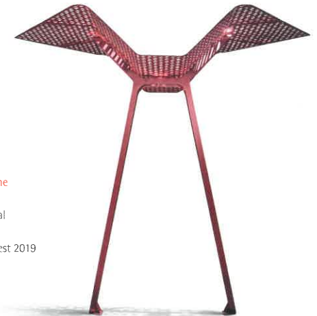
Arpino OXS Design Line Stadtmobiliar Arpino, Angola/Portugal In-house Design Red Dot: Best of the Best 2019

Die Ausstellung in der White Hall präsentiert die 80 besten Produkte des Jahres 2019 – die derzeitigen Meilensteine im internationalen Produktdesign. Sie erfüllen die vier Qualitäten guten Designs, die Qualität der Funktion, des Gebrauchs, der Verführung und der Verantwortung. Diese Produkte setzen neue Standards in ihrer jeweiligen Branche und heben sich durch ihre Innovationskraft und ihre Gestaltung in funktionaler und ästhetischer Hinsicht klar vom Wettbewerb ab. Bei jedem Produkt werden diese vier Qualitäten anhand einer Infografik anschaulich gemacht.